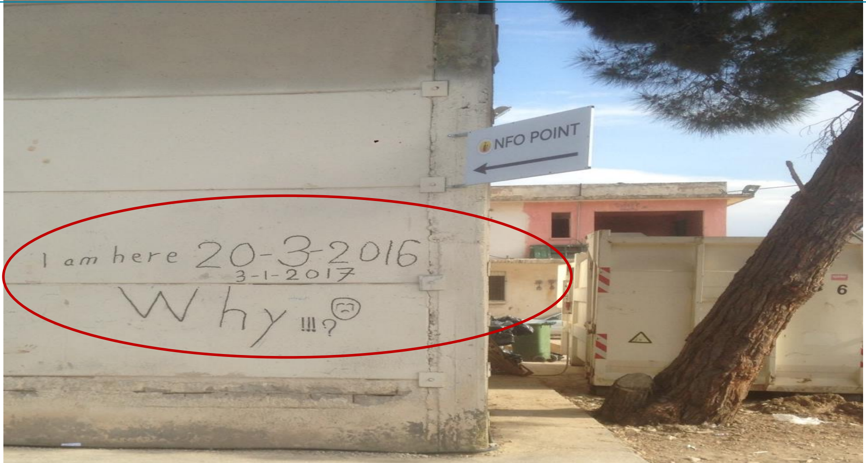
EU Hotspot Vial, Chios – 2016/2017